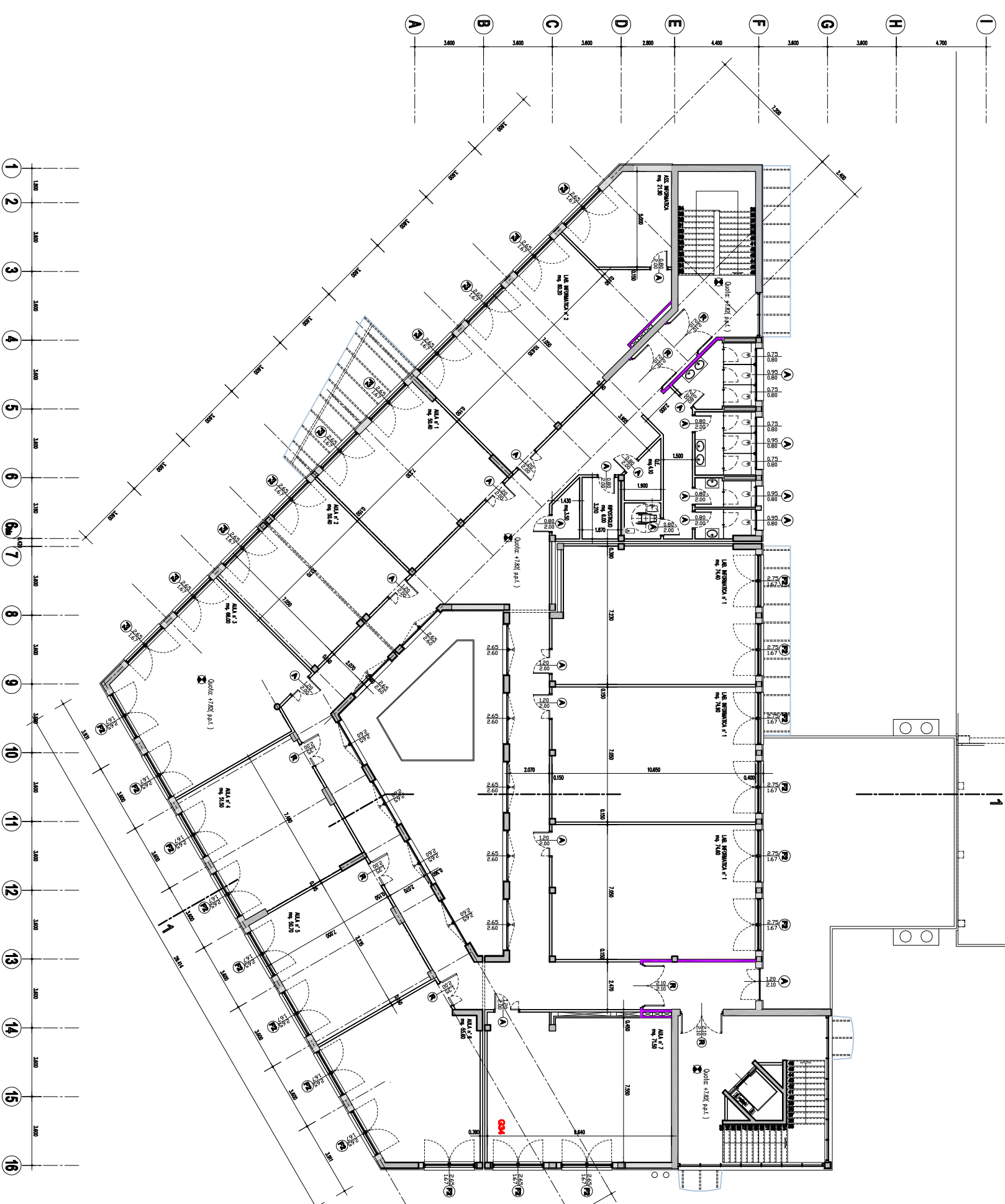
PIANTA PIANO PRIMO 1:100